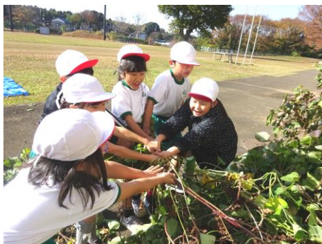
みんなでさつまいも掘りをしました。